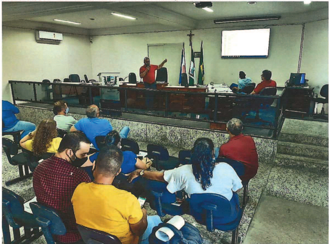
Essas fotos são da Audiência Pública de Apresentação do PPA 2022-2025